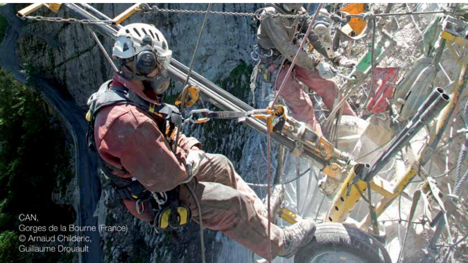
CAN, Gorges de la Bourne (France)