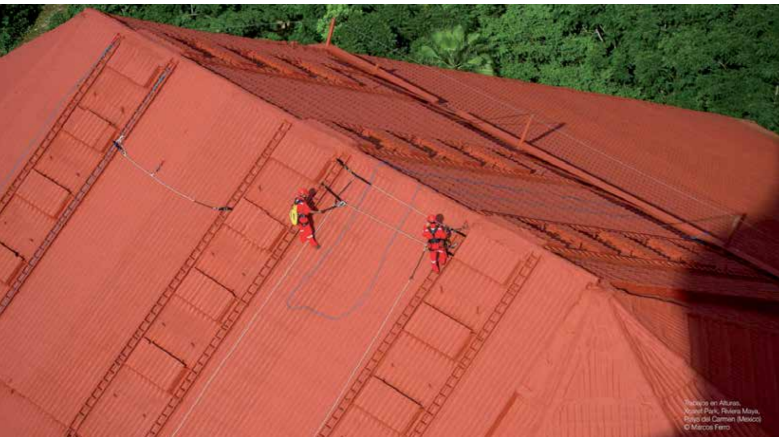
Traccias en Alturas, Acadef Park, Riviera Maya, Playa del Carmen (Mexico)