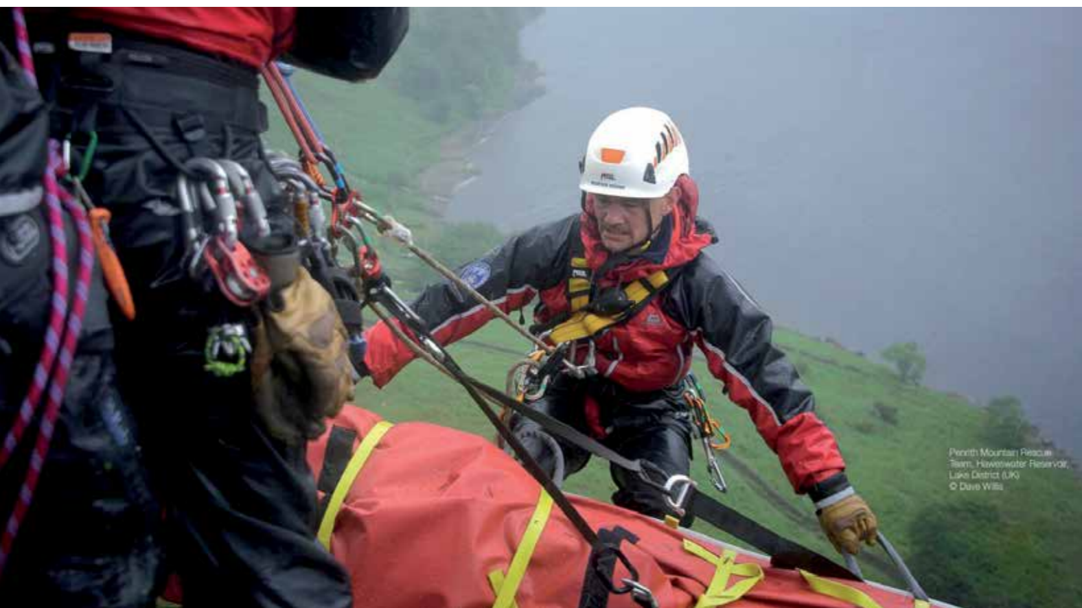
Penrith Mountain Rescue Team, Haweswater Reservoir, Lake District (UK)