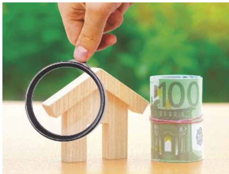
↑ Anche le spese per la verifica sismica danno accesso al bonus

del contribuente dal 1° luglio 2020 fino al 31 dicembre 2021. È importante notare che non è la data di inizio lavori che fa fede per la fruizione delle detrazioni fiscali potenziate, ma la data effettiva del pagamento. Questo vuol dire che il superbonus si applica anche ai lavori cominciati prima della pubblicazione del decreto. Per la piena operatività di queste misure bisogna però ancora aspettare le disposizioni attuative dell'Agenzia delle Entrate ed un apposito decreto, atteso entro il 18 luglio.