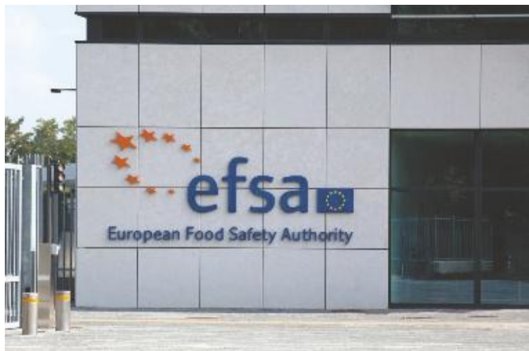
↑ L'Efsa ha sede a Parma ed è l'Authority europea in materia di food safety

Per aderire alle nostre iniziative e comunicare sui nostri speciali contatta il numero 051 6033848 o scrivici a spe.bologna@speweb.it Visita gli speciali on line sul sito www.ilrestodelcarlino.it