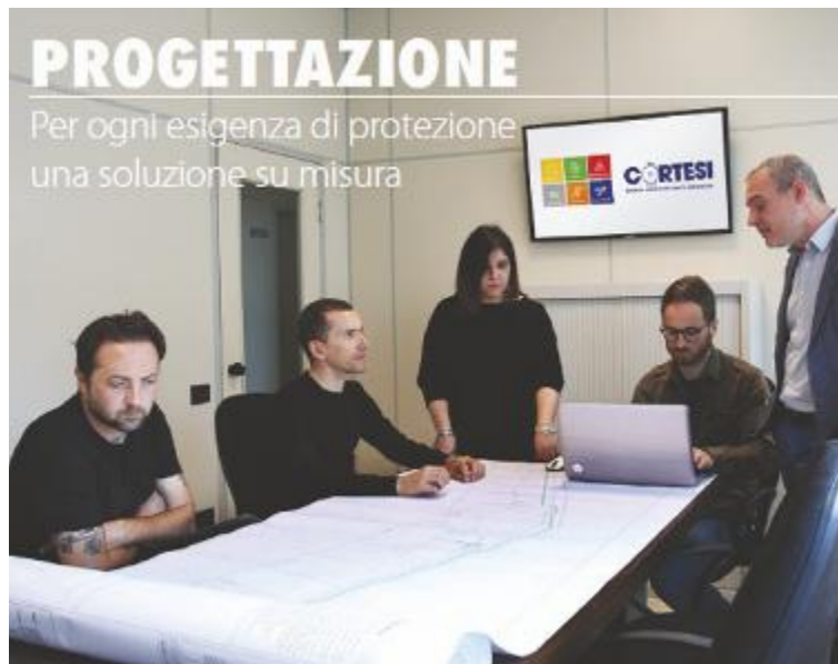
↑ Il team di progettazione a lavoro

per Elettronica Cortesi è intesa a 360 gradi e, dalla progettazione fino all'installazione per proseguire con la manutenzione, tocca sfere diverse: dall'antifurto all'antincendio, dalla cybersecurity al controllo accessi, dalla videosorveglianza alle misure anti-Covid. L'obiettivo è garantire una protezione multipla: di oggetti e beni, del lavoro, delle persone, dei dati, delle strutture. Un obiettivo ambizioso che oggi più che mai richiede competenze di alto profilo e sempre aggiornate. Per questo Elettronica Cortesi investe in una formazione