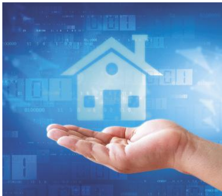
↑ L'obiettivo è quello di massimizzare le coperture e minimizzare i costi