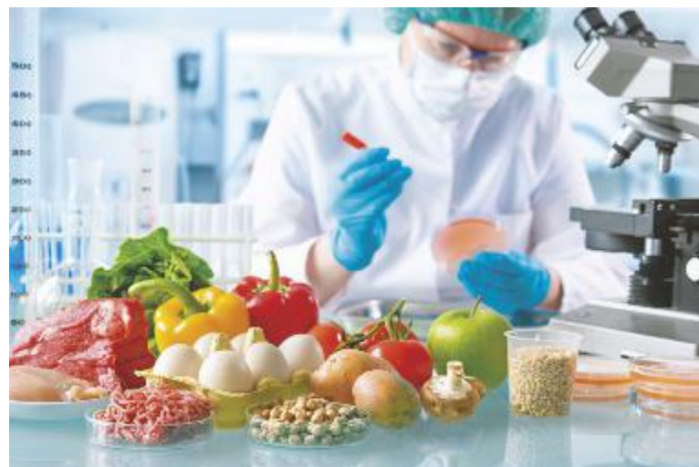
↑ L'HACCP sono le procedure per garantire la salubrità degli alimenti