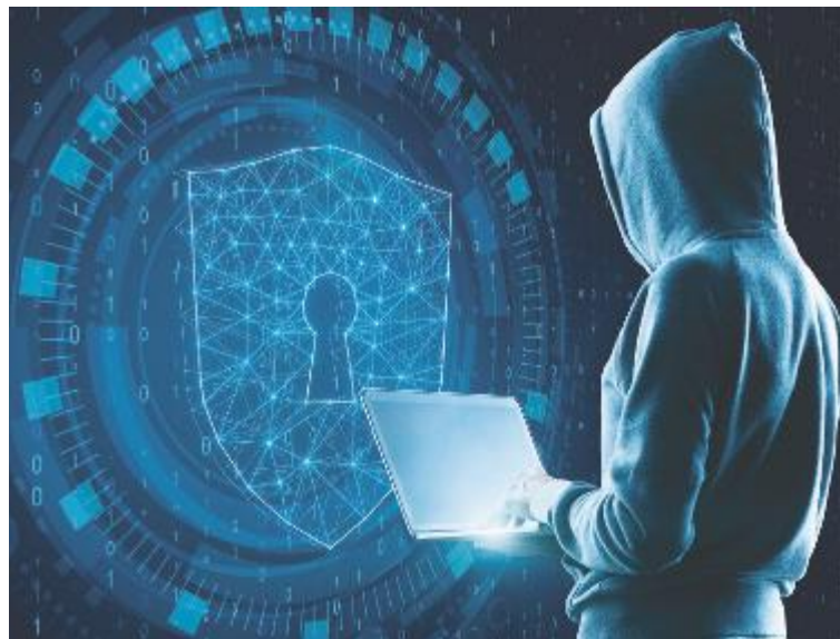
↑ Phishing e furti d'identità sono fra le frodi online più diffuse

22.687 gli spazi virtuali sequestrati. Numeri che fanno pensare e che invitano alla prudenza. Continuamente si scoprono nuove modalità con cui ogni giorno si attuano truffe ai danni dei più deboli e di chi ha meno dimestichezza con i device digitali. E se cambia la modalità della truffa (interazione virtuale anziché faccia a faccia) non cambiano dinamiche e motivazioni su cui gli imbrogliatori fanno leva per attirare nella trappola: fra queste ci sono, per esempio, acquisti che vengono presentati