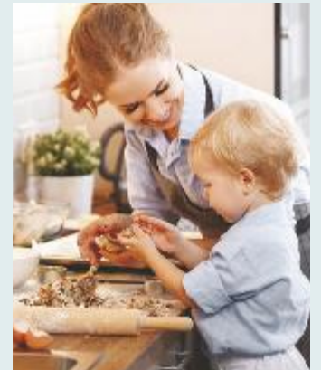
↑ Bastano poche accortezze per non correre rischi inutili

Questo perché in caso sporgessero si rivelerebbero molto pericolosi per i bimbi che potrebbero provare ad afferrarli oppure urtarli per sbaglio mentre si muovono in cucina. È importante anche fare atten-