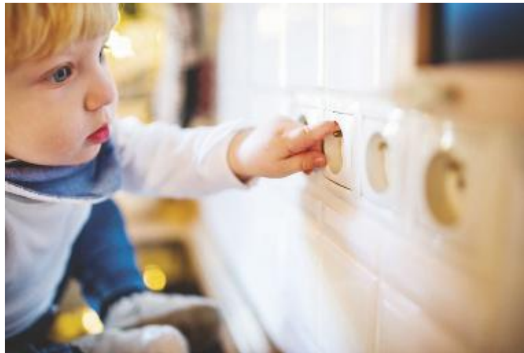
↑ Le prese della corrente rappresentano da sempre un pericolo per i piccoli

Consigli / È bene osservare alcune importanti regole per non incappare in sgradevoli sorprese