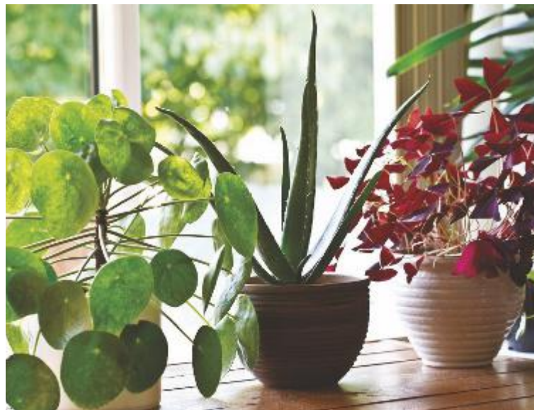
↑ Un tocco di verde per vivere un'atmosfera decisamente più salubre

Proprio per purificare è altamente consigliato l'utilizzo di piante che forniscono nuovo ossigeno combattendo la presenza nell'aria di anidride carbonica. Sansevieria, falangio, ficus, dracena, anthurium ma anche gerbera e edera sono tra le piante più indicate per purificare l'aria della propria abitazione in modo corretto. Ma l'elenco di piante "amiche del benessere" è davvero nutrito e, prima di procedere con gli acquisti, è consigliabile raccogliere informazioni al riguardo per effet-